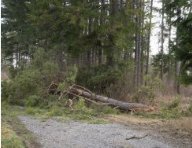
Diesmal eine große Kiefer auf unserem Grundstück Flst.Nr. 828 (Nord – am Weg)

Wieder hat der Sturm mehrere Bäume „gefällt“