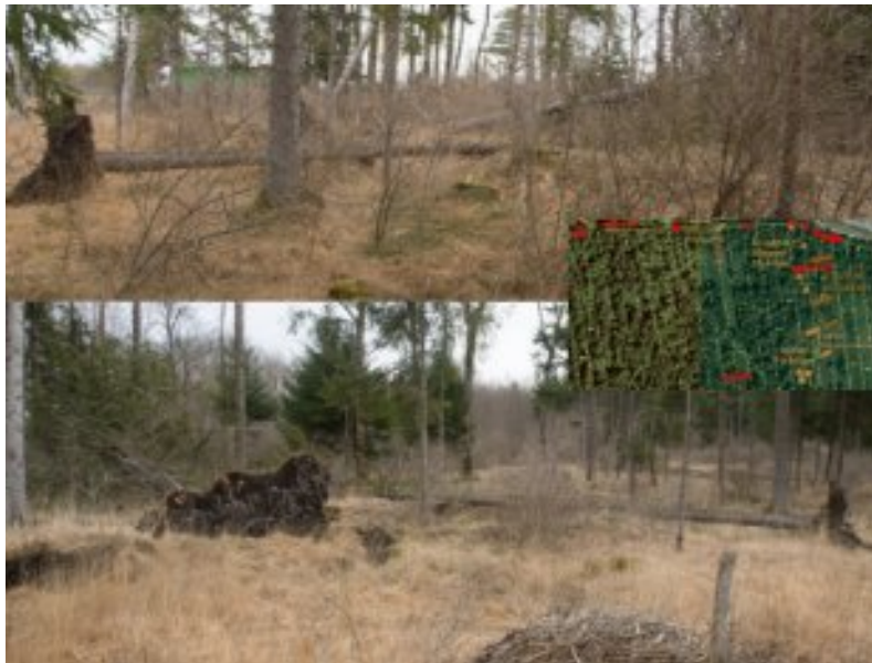
und mehrere Fichten auf den Grundstücken Flst.Nr. 821-823 (Nördl. - am Bach)

2. März Vormittag, es ist kalt, aber noch Trocken und kaum ein Wind.