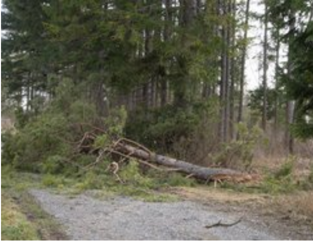
Diesmal eine große Kiefer auf unserem Grundstück Flst.Nr. 828 (Nord – am Weg)

Wieder hat der Sturm mehrere Bäume „gefällt“