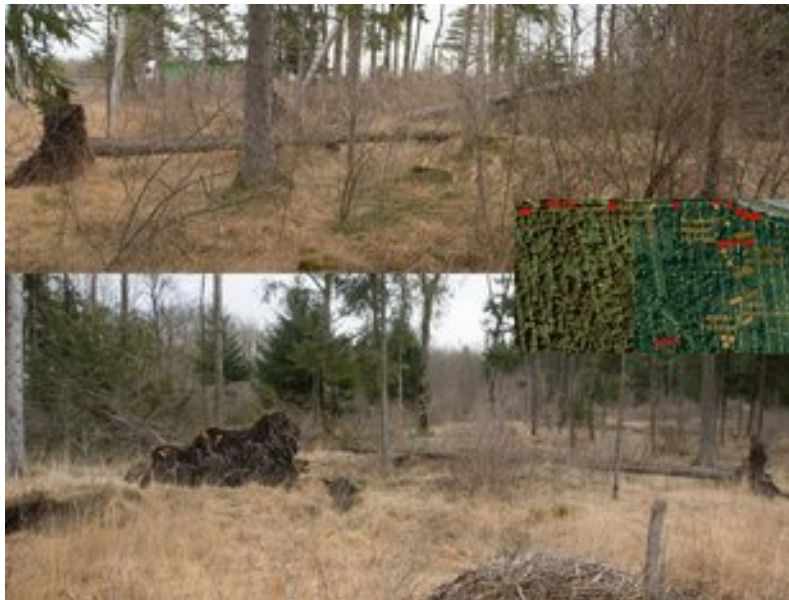
und mehrere Fichten auf den Grundstücken Flst.Nr. 821-823 (Nördl. - am Bach)

2. März Vormittag, es ist kalt, aber noch Trocken und kaum ein Wind.