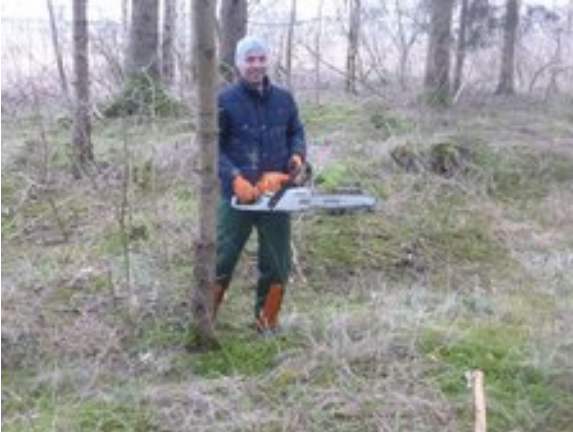
Sägearbeiten dann natürlich mit Helm usw.

24.März Nachmittag, das Wetter ist trübe und kalt.