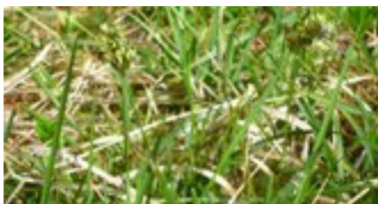
Kalk-Blaugras ( Sesleria caerulea )